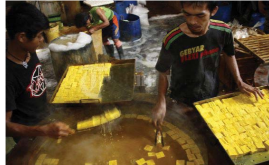
Gambar: pabrik tahu

Perhatikanlah gambar diatas !, jika kalian pernah mengunjunginya kalian pasti tahu bahan baku yang dibutuhkan, cara membuat atau masalah-masalah yang ada. Seperti, penyediaan bahan baku, tenaga kerja, permodalan dan sebagainya. Dalam upaya mencukupi kebutuhan tersebut timbul pokok masalah mendasar yang menjadi pertanyaan dan harus dipecahkan, meliputi: Apa yang dapat diproduksi? Bagaimanakah cara memproduksi? Dan kepada siapa saja produksi tersebut akan dijual?