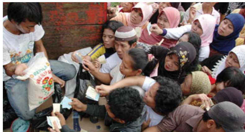
Gambar: orang mengantri sembako