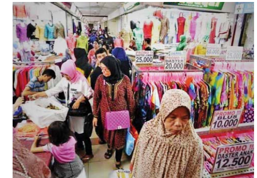
Orang sedang membeli baju