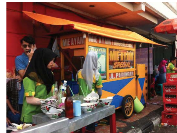
Gambar: orang membeli baso

Sumber daya yang digunakan untuk memenuhi kebutuhan jumlahnya terbatas, sehingga terkadang uang yang digunakan untuk memenuhi satu kebutuhan tidak dapat sekaligus digunakan untuk memenuhi kebutuhan yang lain.