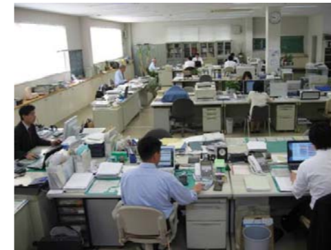
Orang sedang bekerja

Perhatikan gambar di bawah ini! Dapatkah kamu menceritakan kegiatan apa yang sedang dilakukan orang tersebut? Kenapa orang perlu melakukan kegiatan tersebut?