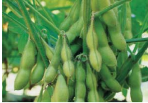
Gambar: tanaman kacang kedelai