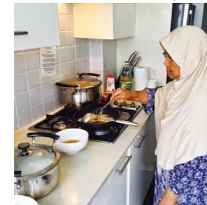
Orang sedang memasak

Orang sedang bekerja, Orang sedang membeli baju, Orang sedang memasak, Merupakan kegiatan ekonomi